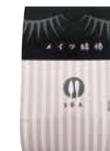
ピンクストライプ