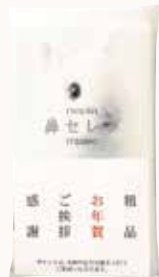
O3T3103 ネピア 鼻セレブ ITSUMO+PLUS 48W ●商品サイズ: W220×D125×H15mm ●入数: 100個 ●出荷: 10ケース以上 ●ケースサイズ: W660×D480×H174mm