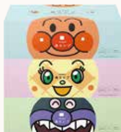
O3T3109 ネピア アンパンマン鼻セレブ ティッシュ 180W 3個パック ●商品サイズ: W248×D119×H255mm ●入数: 10個 ●出荷: 10ケース以上 ●ケースサイズ: W610×D270×H510mm