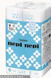
O3T3122 ネピア ネビネビトイレットロール 12ロール シングル 50m巻 無香料 ●商品サイズ: W200×D199×H346mm ●入数: 8個 ●出荷: 10ケース以上 ●ケースサイズ: W801×D403×H363mm