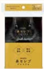
O3T3106 ネピア 鼻セレブ ポケット ティッシュ プレミアム4P 24W ●商品サイズ: W155×D115×H22mm ●入数: 100個 ●出荷: 10ケース以上 ●ケースサイズ: W590×D315×H220mm