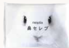
O3T3102 ネピア 鼻セレブ ポケットティッシュ12W ●商品サイズ: W120×D80mm ●原紙サイズ: 210×200mm ●入数: 500個 ●出荷: 10ケース以上 ●ケースサイズ: W575×D264×H385mm