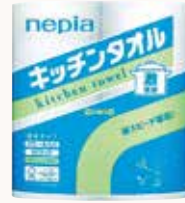
O3T3124 ネピア 激吸収キッチンタオル 2ロール 2枚重ね 50カット ●商品サイズ: W201×D98×H235mm ●入数: 24個 ●ケースサイズ: W606×D395×H481mm