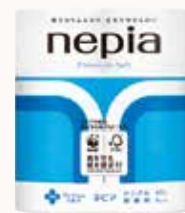
O3T3114 ネピアプレミアムソフトトイレットロール 4ロール シングル 60m巻 無香料 ●商品サイズ: W212×D109×H234mm ●入数: 12個 ●出荷: 10ケース以上 ●ケースサイズ: W428×D331×H479mm