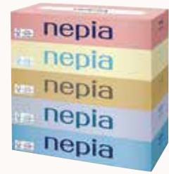
O3T3111 ネピア ネピアティッシュ 150W 5個パック ●商品サイズ: W227×D116×H225mm ●入数: 12個 ●出荷: 10ケース以上 ●ケースサイズ: W477×D368×H477mm