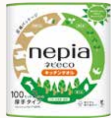
O3T3131 ネピeco キッチンタオル 2ロール100カット ●商品サイズ: W225×D117×H250mm ●入数: 24個 ●ケースサイズ: W677×D447×H477mm