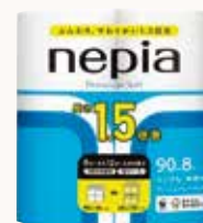
O3T3118 ネピアプレミアムソフトトイレットロール 1.5倍巻 8ロール シングル 無香料 ●商品サイズ: W229×D218×H232mm ●入数: 8個 ●出荷: 10ケース以上 ●ケースサイズ: W461×D441×H476mm