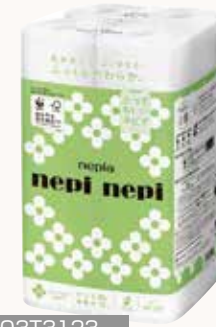
O3T3123 ネピア ネビネビトイレットロール 12ロールダブル 25m巻 無香料 ●商品サイズ: W200×D199×H346mm ●入数: 8個 ●出荷: 10ケース以上 ●ケースサイズ: W801×D403×H363mm