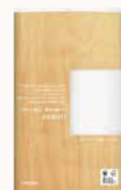
O3T3120 ネピア asmori(アスモリ) 6ロール シングル120m ●商品サイズ: W222×D111×H342mm ●入数: 8個 ●出荷: 10ケース以上 ●ケースサイズ: W461×D446×H357mm