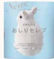
O3T3112 ネピア おしりセブトイレットロール 4ロールダブル2枚重ね40m巻無香料 ●商品サイズ: W205×D107×H228mm ●入数: 20個 ●出荷: 20ケース以上 ●ケースサイズ: W535×D420×H476mm