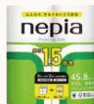
O3T3119 ネピアプレミアムソフトトイレットロール 1.5倍巻 8ロール ダブル 無香料 ●商品サイズ: W229×D218×H232mm ●入数: 8個 ●出荷: 10ケース以上 ●ケースサイズ: W461×D441×H476mm