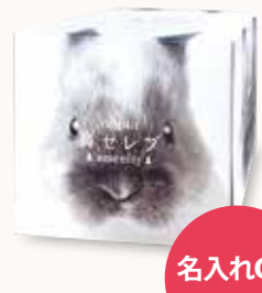
O3T3105 ネピア 鼻セレブ amenity BOXティッシュ130W ●商品サイズ: W120×D110×H120mm ●入数: 48個 ●ケースサイズ: W501×D381×H457mm