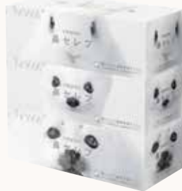
O3T3108 ネピア 鼻セレブティッシュ 200W 3個パック ●商品サイズ: W248×D119×H270mm ●入数: 10個 ●出荷: 10ケース以上 ●ケースサイズ: W612×D286×H518mm