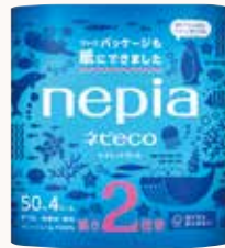
O3T3132 ネピeco トイレットロール 2倍巻4ロールダブル ●商品サイズ: W227×D117×H250mm ●入数: 12個 ●ケースサイズ: W458×D356×H476mm