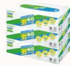
O3T3126 ネピア 激吸収キッチンタオル ボックス 75W 3個パック ●商品サイズ: W248×D119×H240mm ●入数: 12個 ●ケースサイズ: W501×D372×H515mm