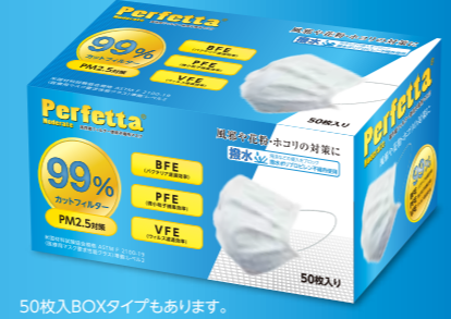
50枚入BOXタイプもあります。

製造元: フー パオ メディカル 世界のトップ10アジア企業の1つに位置付けられる ベトナムのヘルス&パーソナルケア製品のトップサプライヤー