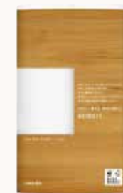
O3T3121 ネピア asmori(アスモリ) 6ロール ダブル 60m ●商品サイズ: W222×D111×H342mm ●入数: 8個 ●出荷: 10ケース以上 ●ケースサイズ: W461×D446×H357mm