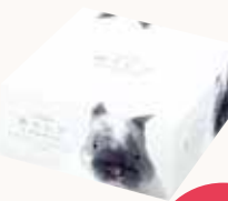
O3T3104 ネピア 鼻セレブ amenity BOXティッシュ 62W ●商品サイズ: W120×D120×H56mm ●入数: 80個 ●ケースサイズ: W495×D495×H290mm