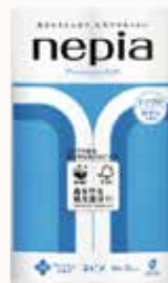
O3T3128 ネピアプレミアムソフトトイレットロール 12ロール シングル 60m巻 香料付き ●商品サイズ: W214×D208×H346mm ●入数: 8個 ●出荷: 10ケース以上 ●ケースサイズ: W855×D422×H361mm