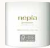
O3T3113 ネピア プレミアムトイレット ロール 1ロール ダブル 40m ●商品サイズ: W111×D109×H118mm ●入数: 80個 ●出荷: 10ケース以上 ●ケースサイズ: W543×D449×H479mm