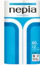
O3T3116 ネピアプレミアムソフトトイレットロール 12ロール シングル 60m巻 無香料 ●商品サイズ: W214×D208×H346mm ●入数: 8個 ●出荷: 10ケース以上 ●ケースサイズ: W855×D422×H361mm