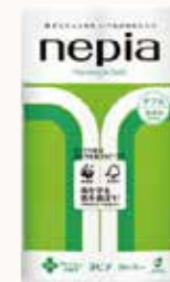
O3T3129 ネピアプレミアムソフトトイレットロール 12ロール ダブル 30m巻 香料付き ●商品サイズ: W206×D200×H346mm ●入数: 8個 ●出荷: 10ケース以上 ●ケースサイズ: W823×D405×H361mm