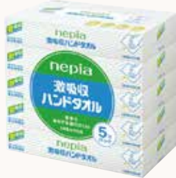
O3T3127 ネピア 激吸収ハンドタオル ボックス100W 5個パック ●商品サイズ: W227×D116×H225mm ●入数: 12個 ●ケースサイズ: W477×D368×H475mm