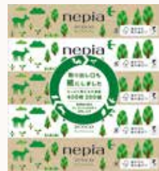
O3T3130 ネピeco ティッシュ 5コパック400枚 ●商品サイズ: W227×D116×H250mm ●入数: 12個 ●ケースサイズ: W530×D366×H475mm