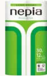
O3T3117 ネピアプレミアムソフトトイレットロール 12ロール ダブル 30m巻 無香料 ●商品サイズ: W206×D200×H346mm ●入数: 8個 ●出荷: 10ケース以上 ●ケースサイズ: W823×D405×H361mm