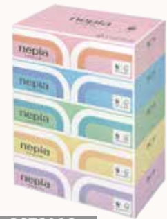
O3T3110 ネピア プレミアムソフト ティッシュ180W 5個パック ●商品サイズ: W227×D116×H310mm ●入数: 12個 ●出荷: 10ケース以上 ●ケースサイズ: W637×D364×H475mm